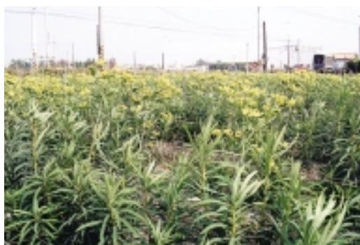
大甲草花花序單生