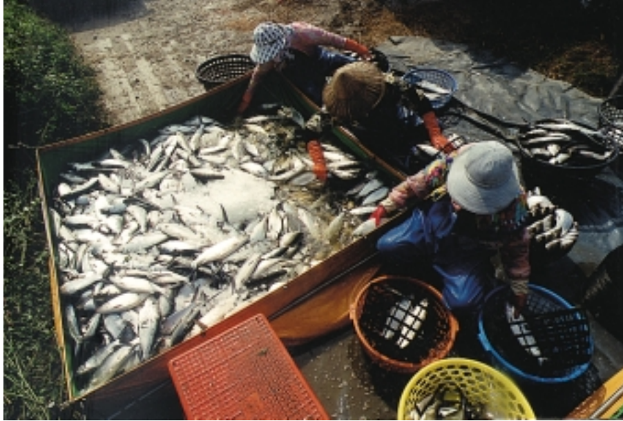
雲林沿海的養殖業紛紛投入台灣鯛的生產行列

品質較佳，就先送往冷凍加工廠，採整尾急速低溫冷凍，魚片冷凍真空包裝（經處理後為新鮮的生魚片），加工廠全部通過國際HACCP的合格認證，得以行銷全世界，深具發展潛