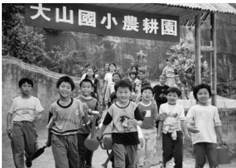
小朋友開心去種菜