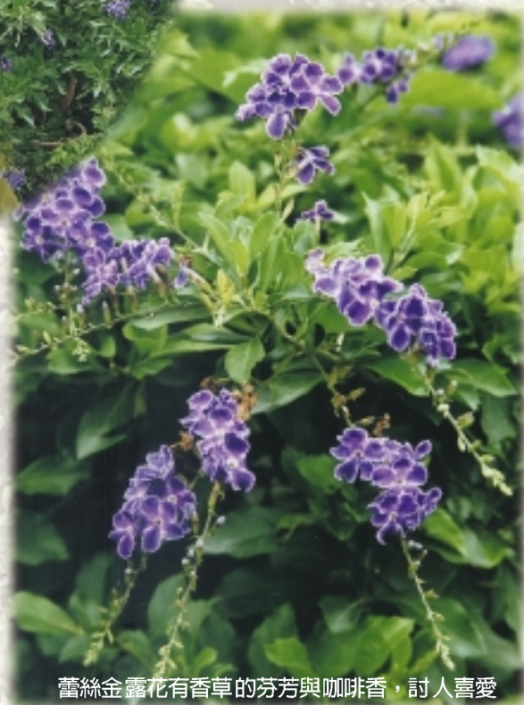
蕾絲金露花有香草的芬芳與咖啡香，討人喜愛