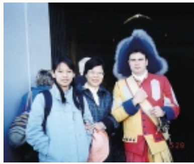
這位教皇宮工作人員(右一)會說國語喔