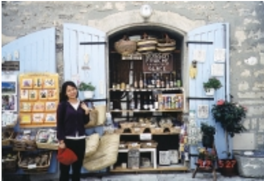
雷博村店鋪裡紀念品不落俗套，令人流連忘返