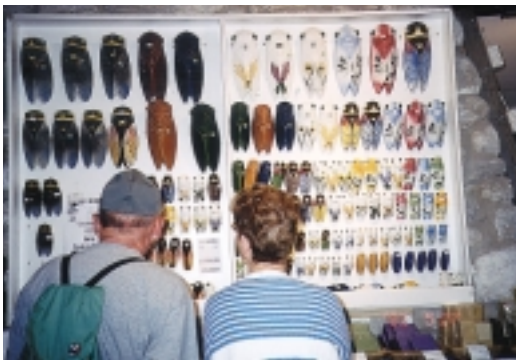
蟬代表著普羅旺斯夏天到了