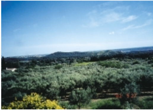
河谷平原的蓊鬱的橄欖樹園