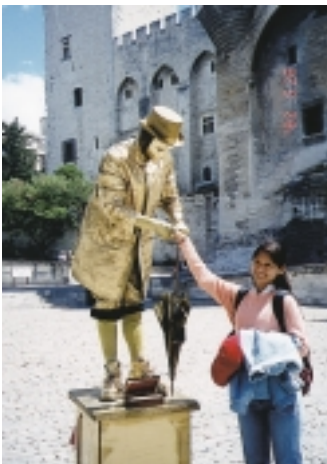
似默劇人物的街頭藝人

依我個人感受，欣賞隆河遠近景觀，比參觀教皇宮 (PALAIS DES PAPES) 有意思多了，雖然始建於13世紀的教皇宮，號稱亞維儂代表建築，