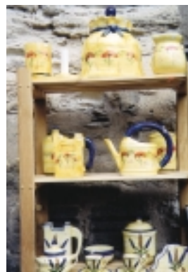
先艷的黃藍白，正是普羅旺斯基本色調