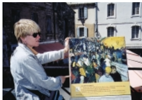
我們的導遊小姐，右耳吊掛著一隻銀製蜥蜴耳環

有過7位教皇駐蹕於此(1309~1376)，可是宮內設施不如外貌，尤其弄不懂的是，對參觀者既有安全檢查，又不准拍照，何以一進皇宮，就見中庭裡有個大型人工看台，一些為藝術節活動佈置場地的人，還在忙碌敲敲打打中，古蹟不是該好好保護的嗎？心中難免疑惑。