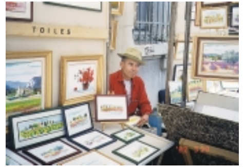
亞威儂街頭畫家打扮乾淨俐落，儼然一幅風景畫

有過7位教皇駐蹕於此(1309~1376)，可是宮內設施不如外貌，尤其弄不懂的是，對參觀者既有安全檢查，又不准拍照，何以一進皇宮，就見中庭裡有個大型人工看台，一些為藝術節活動佈置場地的人，還在忙碌敲敲打打中，古蹟不是該好好保護的嗎？心中難免疑惑。