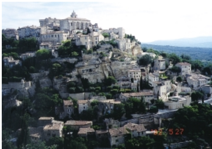
葛氏村採用深淺不一的赭紅色石頭為建材