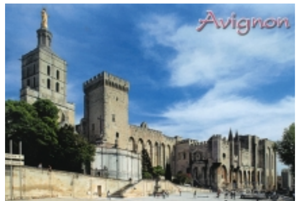
教皇宮是亞威儂的代表建築，始建於13世紀 →

這座完工於1190年的橋，原來有22拱門，900公尺長，但幾次大水災，讓它只剩現在四個拱門，其名叫聖貝內滋