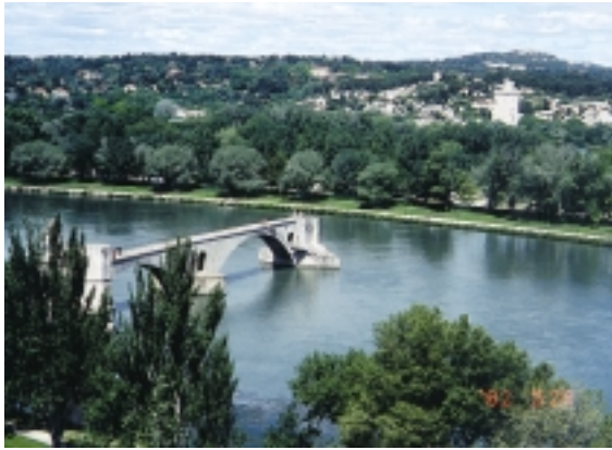
聖貝內滋橋因法國有「亞維儂斷橋」民謠而聞名

→ 的牧羊人，當年以近乎神蹟的募款故事，隨著隆河悠悠河水，至今仍被流傳著，當年築橋時，兩岸分屬法國、普羅旺斯兩個不同獨立領域，也就是過一座橋要付兩次稅者，爾今也成為歷史故事了。