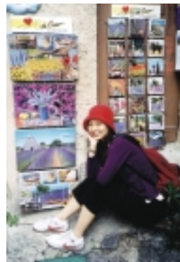
6月不是薰衣草開花季節，只好去買圖片、書中找

這當中，描素各式各樣紀念品都不落俗套者，兩座山城都一樣，有機會去觀光的人，建議可在此好好SHOPPING