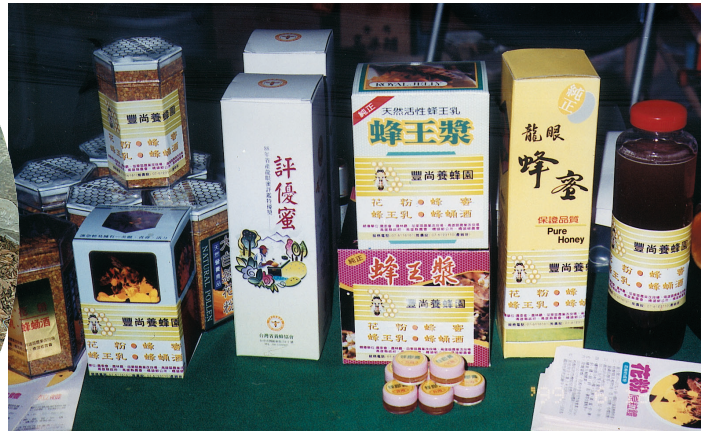
橋頭養蜂產銷班第1班的產品包裝精良