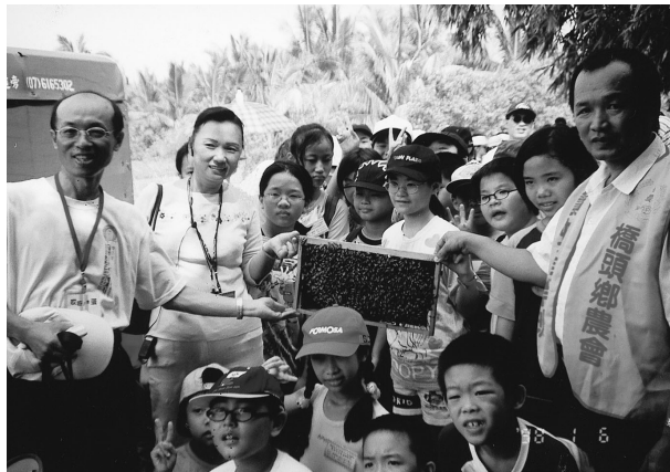
透過蜜蜂生態解說，教育消費者