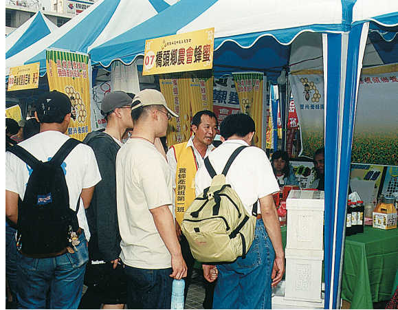
黃班長（右二）喜歡參加展售會促銷產品