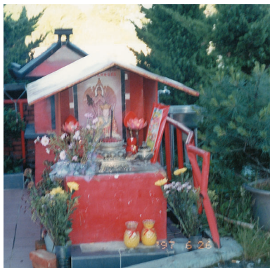
標高海拔2,600公尺的小雪山小廟之一

大雪山森林遊樂區可由東勢過東豐大橋，循一號省道，再由東坑直達，遊樂區標高約2,165公尺，內有小木屋，對面是森林步道，遠處小溪流傳出淙淙水聲，讓遊客舒展身心。林木有台灣杉、檜木（紅豆杉）、鐵杉等，高大筆直的林木，濃蔭遮天，涼風輕拂，飄來「芬多精」樹香，讓旅客享受森林浴。