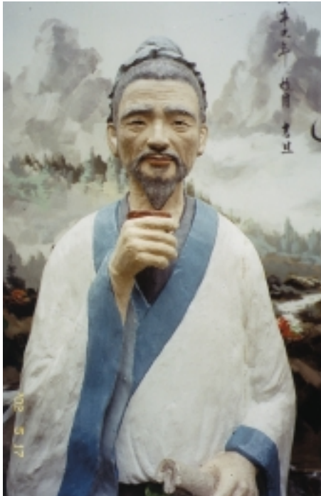
台灣菸酒公司埔里酒廠塑造的酒仙李白雕像

誤事。也就是說：如果發現有人結群而飲，那就是格殺無論，這是中國酒史上首次立法，苛刑立法爲了避免亡國的危險。周代禁酒，並不是一概而論，凡是符合禮節的飲酒，如國祀，拜神，鄉里宴賓客，奉養尊長等，都不在禁止之列；而那些『非時機』的飲者，則是禁止的對象。但是，大規模真正的酒禁在中國只有幾次，並且絕非因爲酗酒造成社會問題，而是爲了備戰累積物資，或因天災人禍一年荒谷貴，才禁止有關酒的一切活動。