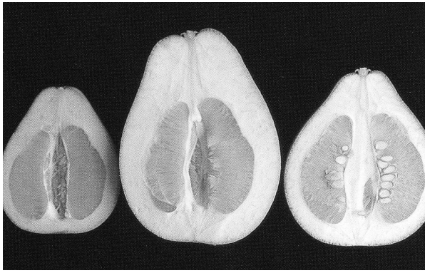
左：果實小，皮薄，無子，品質佳 中：果實大，皮厚，果梗部突起，品質差 右：果實大，種子多，品質差