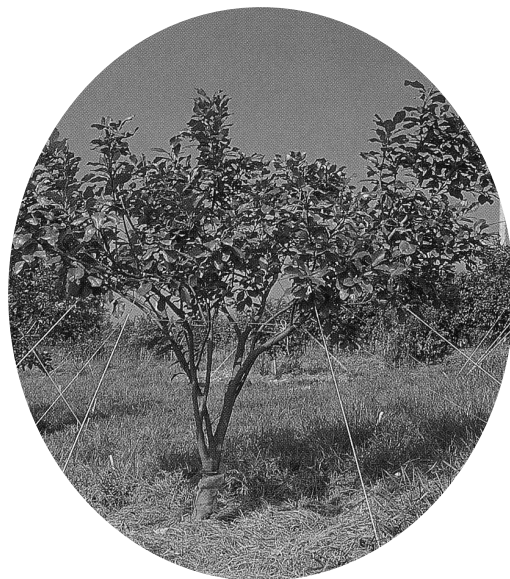
利用繩索誘引調整枝梢角度及方向