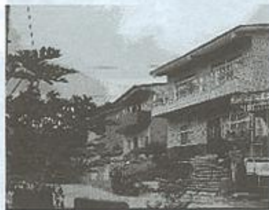
澗水聚落住宅精建