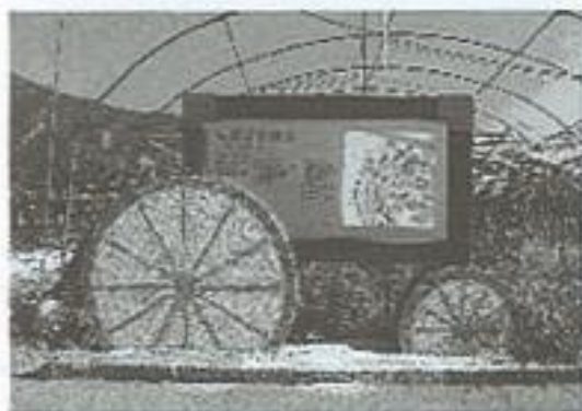
福龜具有農村風味的解說牌