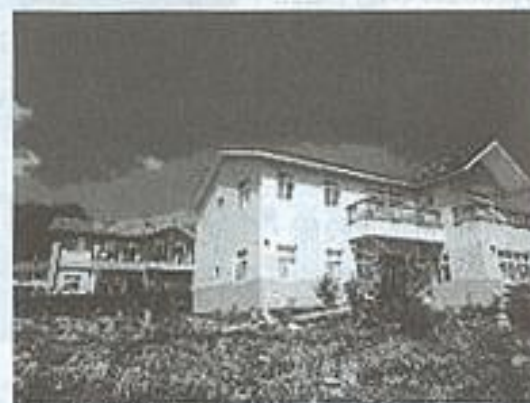
澗水聚落住宅精建