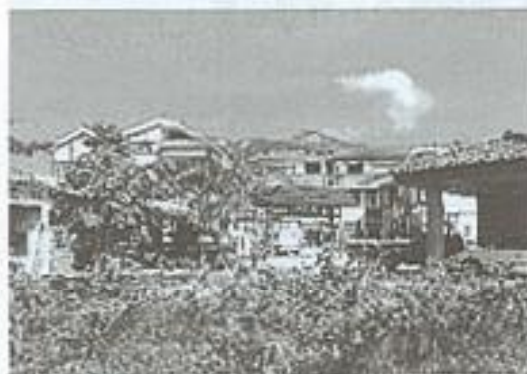
魏家村5戶住宅重建成果