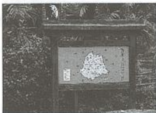
大雁村澀水社區入口解說牌