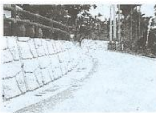
環村道路拓寬改善