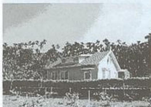
涂石松住宅重建成果