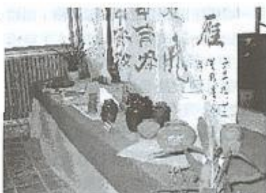
澀水居民陶藝作品