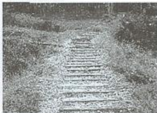
田在地居民動手完成的澀水登山步道