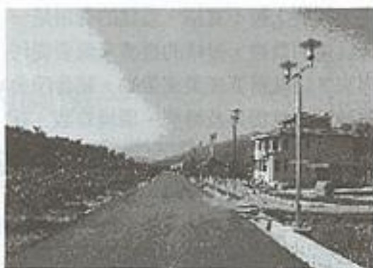
19鄰道路及路燈改善