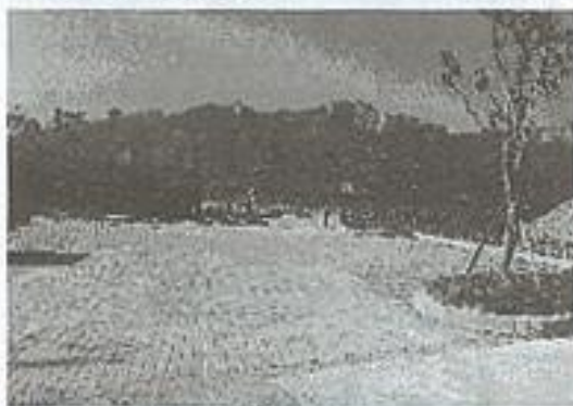
番仔城停車場，可遠眺九九峰