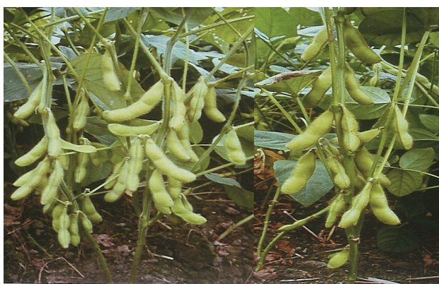
毛豆新品種「綠蜜—高雄6號」及「黑蜜丹波—高雄7號」

考及格，退伍後（民國55年）分發至高雄區農業改良場服務，在30餘年的工作期間，除短暫借調中華民國駐外農技團工作外，長期以來皆從事雜糧作物品種改良及高屏地區稻田輪作栽培制度改進，鄭副研究員表示，他於民國61年至63年、民國69年至71年及民國74年至76年，先後到過查德、波札那共和國、沙烏地阿拉伯王國及烏拉圭、瓜地馬拉共和國擔任農技團農藝技師。鄭副研究員在工作期間，不論是在國內或國外，皆抱著全力以赴的精神，戮力不懈，育成的新品種，先後有毛豆新品種高雄選1號、高雄2號、高雄3號及高雄5號。其中高雄選1號及高雄5號分別曾榮獲台灣省政府民國80年及民國88年農業研究發展基金一等及二等獎。