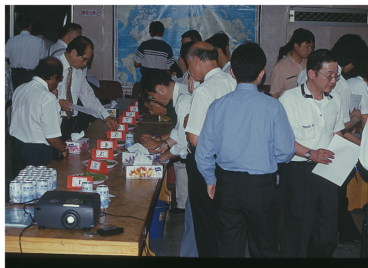
2000年日台毛豆貿易懇談會在高雄區農業改良場召開，日台與會人士品嚐新品系（種）冷凍毛豆產品之情形