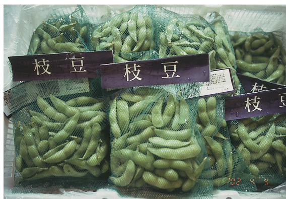
台灣毛豆產品在國際市場奠定了高品質及高價位形象

1,704公頃，年產量有13,532公噸；屏東縣有1,461公頃，年產量有9,112公噸，三縣栽培面積佔全省總面積之66.9%。