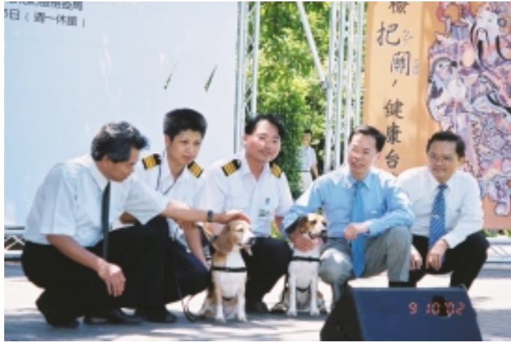
現場貴賓與檢疫員及其檢疫犬組合合影

與種類正大幅增加，動植物疫病蟲害隨著貿易或旅遊等各種途徑傳入國內的風險急劇升高，防疫檢疫的工作也必須持續加強。配合財政部推動的快速通關政策，為避免外來疫病蟲害隨著旅客傳入我國，防檢局特地參考美國等國家的做法，成立檢疫犬隊。