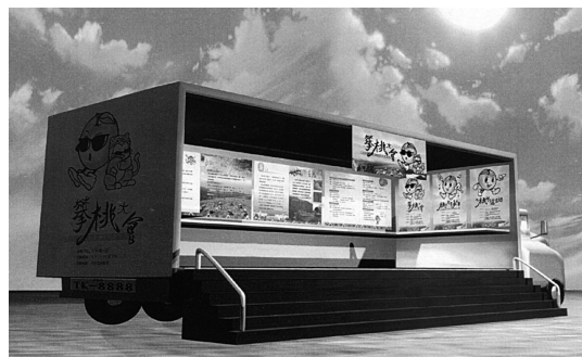
「梨山水蜜桃觀光季」巡迴展示專車面觀設計圖