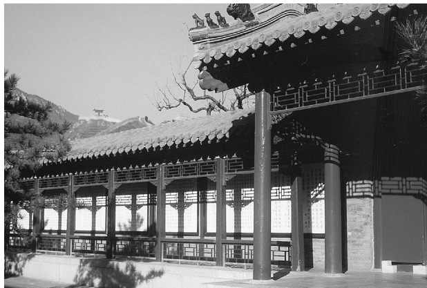
小巧玲瓏與專題的居庸關碑林

行、隸、楷、魏四種字體書寫。石碑用漢白玉雕刻而成，總面積58平方公尺。規模雖然比不上「西安碑林」的宏偉及「桂林碑海」的壯觀，但她卻有「專題碑林」的特點與小巧玲瓏之美的特色，對探討居庸關長城歷史的人士與愛好詩詞、書法的墨客、遊人，確是一個難得的好地方。