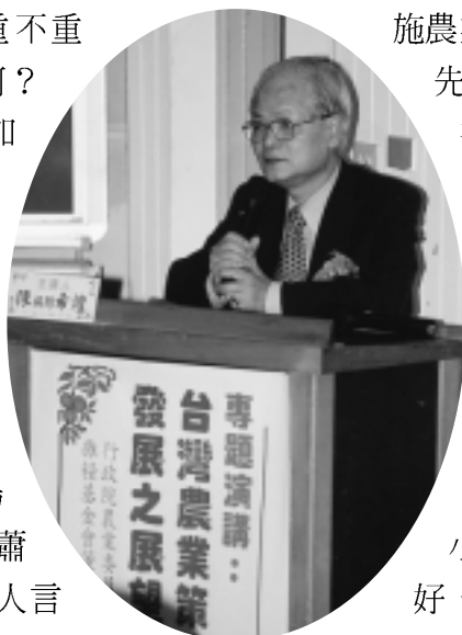
農委會前主委陳希煌先生主講台灣農業策略聯盟發展之展望

施農業策略聯盟的第1人，他以先知先覺的獨到眼光，深入淺出的分析、說明台灣農業為什麼要推動策略聯盟。他說，台灣在加入WTO後，政府慢慢撤離各行各業的保護傘，所以競爭壓力與日俱增。然而，台灣農業要轉型應付國際競爭，如果保持小農原貌，不但吃力不討好，而且佔盡劣勢。因此，必須整合現有資源，發揮經濟規模效率、技術效率、管理效率和行銷效率，而這些只能靠策略聯盟來完成。他進一步指出，台灣農產品應該走