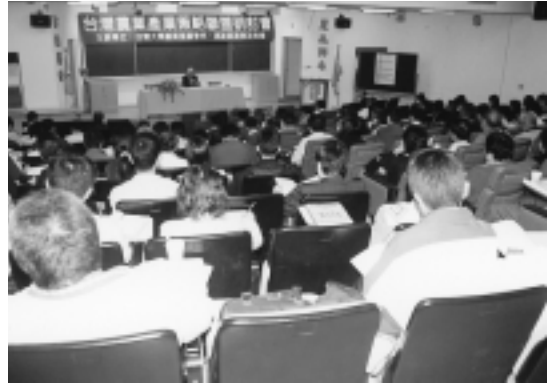
專題演講，座無虛席

出去，著眼世界市場競爭，而且是所得較高的地區，所以策略聯盟要創造品牌，代表安全、衛生，讓消費者吃得安心，才會放心的購買我們的產品。