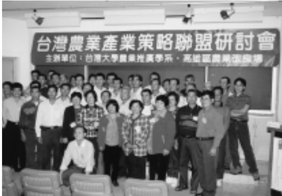
蓮霧果農最捧場來了近百位