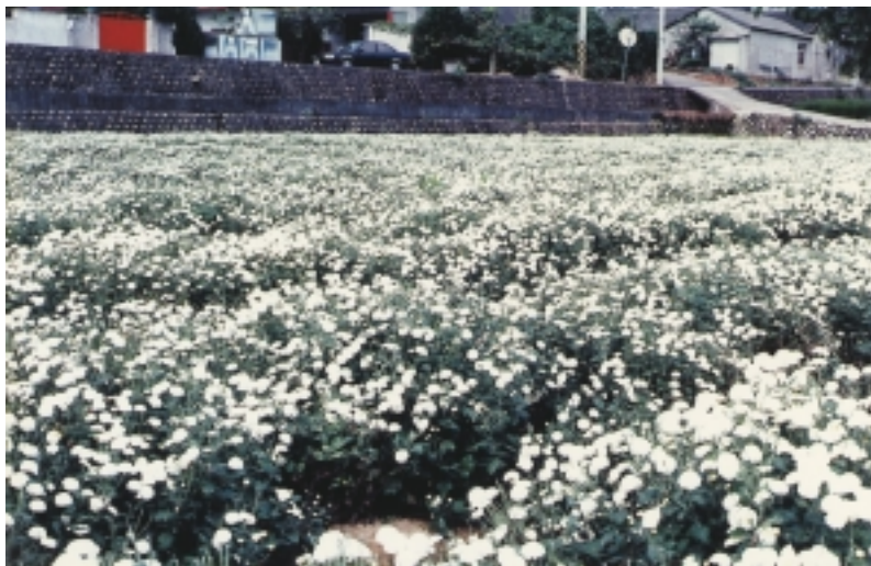
杭菊盛開的景色，如皚皚白雪

片杭菊盛開的綺麗風光所吸引住，一畝畝高低花浪菊花園，淡白金色的小花朵，迎風搖曳，蔚為美觀。