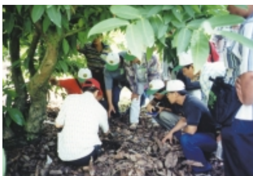
「常綠果樹栽培管理班」田間研習蓮霧有機栽培管理技術（高雄區農業改良場）

豬、羊)、農特(畜)產品加工、休閒農業經營管理、農企業經營管理、農機保養修護及醱酵製酒類等訓練班計61班，訓練經費大部分由政府負擔，惟學員須自付部分膳宿雜費、實習材料費及教材費，其中參加1週期之豬隻人工授精班者每人3,000元，農機保養修護班每人1,000元，乳牛胚胎移置訓練班需由學員自付器具費每人20,000元，結訓後器具由學員帶回使用；此外，參加2週期之乳牛(乳肉羊)人工授精班者每