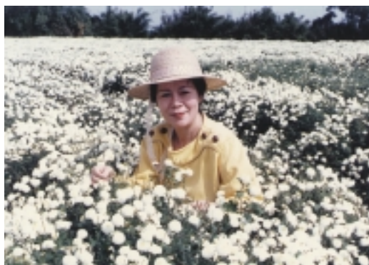
一望無際的花海，美不勝收

每年時序進入晚秋，正是「採菊東籬下，悠然見南山」的時候，山城苗栗縣銅鑼鄉郊外，遊客的目光往往會被這