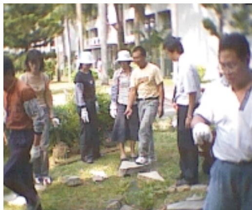
「造園設計及景觀佈置訓練班」講師講授「日式庭園設計」實習情形(台糖訓練中心)

農委會為積極培育具國際觀及農業專業經營能力之優秀農民，持續舉辦農村青年中、短期農業專業訓練，92年度規劃辦理花卉、果樹、蔬菜、茶葉、食