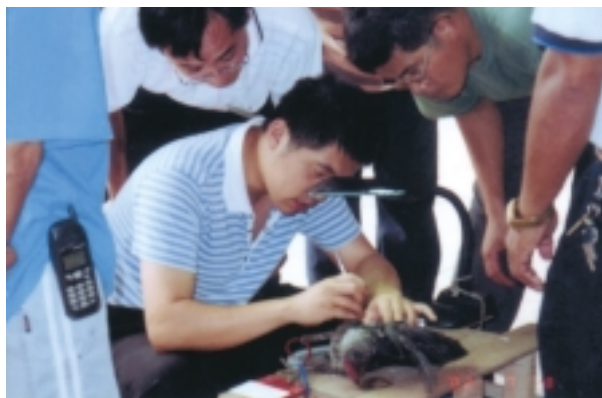
「土雞飼養管理訓練班」闖雞實習操作（畜產試驗所）

目前從事該項生產且年齡近45歲者、參加產銷班者、上一年度報名未獲遴選者皆列入優先遴選對象；參加蓮霧栽培管理班者，以目前從事蓮霧生產具二年以上經驗者為優先；參加畜牧類訓練者，以具畜牧場登記證書者為優先；參加微生物農藥與微生物肥料訓練班者，以有機栽培經營農民為優先。各訓練班除乳牛胚移置訓練班每班10人，乳牛人工授精訓練班每班20人，其餘每班均招訓30名，訓練單位包括農委會所屬各區農業改良場、農業試驗所、農業藥物毒物試驗所、畜產試驗所、茶業改良場、種苗改良繁殖場、宜蘭技術學院、中興大學、朝陽科技大學、嘉義大學、屏東科技大學及台糖公司訓練中心等18單位，相關招訓通告及簡章已分送各鄉鎮（區）公所、農會、各地農業合作社場、各農業產銷班張貼公告，農村青年亦可直接上行政院農業委員會網站（ www.coa.gov.tw ）查詢詳細資料。農委會竭誠歡迎有興趣的農村青年儘速於92年1月30日前向戶籍所在地的農會推廣股或各地農業合作社場報名參加訓練。