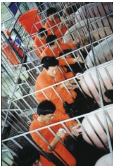
「豬隻人工授精訓練班」上課實習情形（屏東科技大學）

(2)農村青年至農會或農業合作社場報名時應出示相關證明文件（如身分證、工作證明或其他訓練證書等），受理報名單位應確實審核報名表資料是否屬實，並於列印之報名表上註明審查意見簽章後送台灣省農會一份，即完成報名作業。