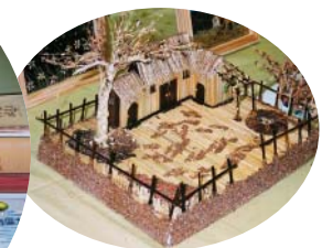
宜蘭縣冬山鄉農會將平凡的稻草變成藝術作品