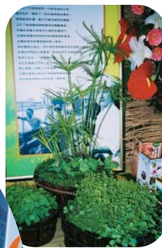
宜蘭縣員山鄉的水草不只觀賞，也是美味的農特產品

伴手禮。遊客到該區遊玩時，可參觀水草種植、古蹟、體驗竹編，還能順手帶回水草食品，令人印象深刻。