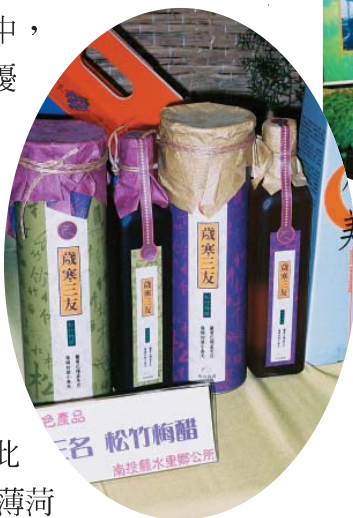
南投縣水里鄉的松竹梅醋是精緻的伴手

漁園區創意大賽，由評審委員從56件複賽作品中，評選出三大類14項優勝作品。得獎作品中，最特別的是宜蘭縣員山鄉農會推出的「水草奇緣系列」產品。宜蘭縣員山鄉農會向來是水草之鄉，由於發現可食用的水草，因此發展出大葉田香、水薄荷和水紫蘇等橄欖油系列，還有田香葉奶酪等