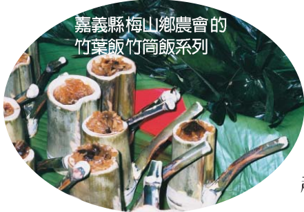
嘉義縣梅山鄉農會的竹葉飯竹筒飯系列