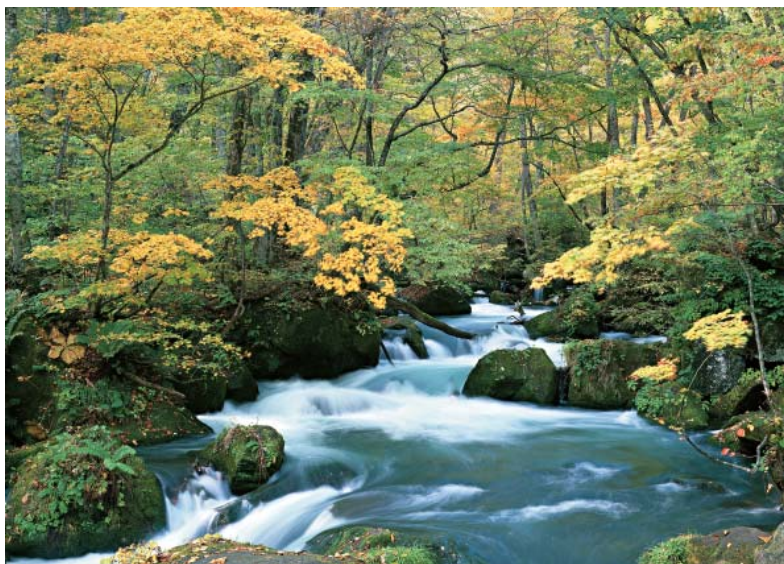
社區營造與林業結合，讓我們的环境更美好，也讓休閒農業有更進一步的發展空間

黃局長表示，「社區林業」計畫推出後，初期即獲熱烈迴響，提出申請的社區相當踴躍，從部落神聖領地踏查、蝴蝶村營造、村民護鳥護林、森林音樂會、排灣鼻笛森林笛響、泰雅族護溪傳