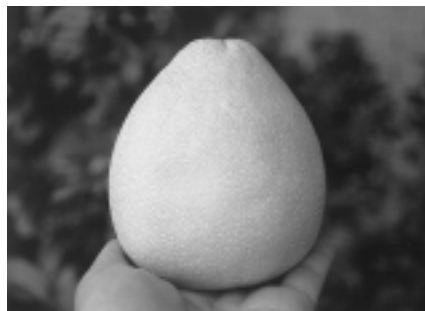
麻豆文旦果小皮薄，有重量感

有適度的低溫，土壤深厚，富含有機質，土壤呈微酸性，並有排水良好的砂質壤土，完全適合文旦的生產，因此造就了名聞全省的麻豆文旦。