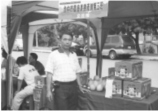
榮獲神農獎得主的古銘家班長，積極參與各項農產直銷活動

有機機肥料，有機質含量應達60%以上，建議可多量施用，每株可施用30公斤以上。有機質肥料施用建議以長期施用或環施為主。