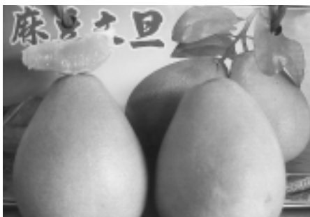
正宗麻豆文旦肉質柔軟，子小、汁多

台灣的文旦以台南麻豆鎮的文旦有其地域上的先天條件，23°C~30°C的天候，春夏多雨，秋冬乾旱，