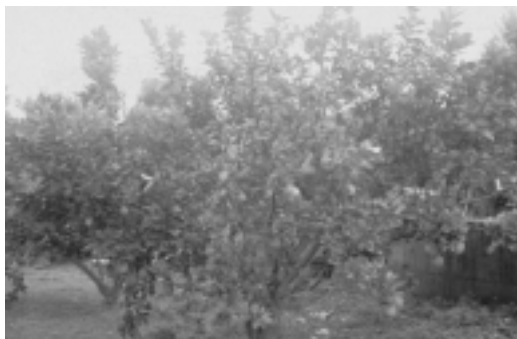
未施用土壤改良資材之文旦柚植株黃化，著果率偏低

台灣地區果園土壤，因長年大量施用化學肥料及農藥，土壤退化，尤其礦物元素被強酸性土壤固定，很難