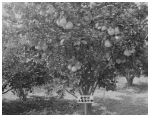
施用新型土壤改良資材後，增加文旦柚著果率及產量

照處理增加14.3%（15.3粒/株）。施有機肥料之處理者，文旦柚著果122.3粒/株，較對照處理增加58.8%（49.6粒/株）。灌注溶磷菌之處理後，文旦柚著果130.2粒/株，較對照處理增加79.1%（57.5粒/株）。