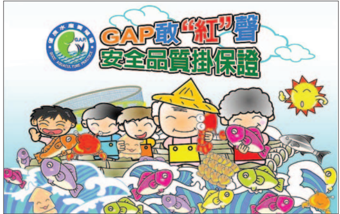
優良養殖場認證標章，養殖水產品有保障

近年來，國人日益重視食品安全，主管農林漁牧生產管理的農委會也將94年訂為「消費安全年」全力強化農畜漁產品的生管安全管理，先後推出許多新的制度，其中生產履歷制度上路，對生產管理的管控多了一層的防護，而最近農委會漁業署也推出的優良養殖漁場的GAP制度，將水產養殖的管理拓展至生產流程的全面管控，同時消費者也可以經由GAP標章的認證，購買安心、安全的養殖水產品。