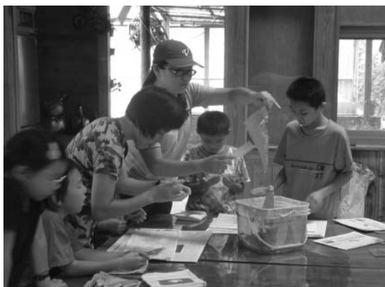
陽明山仙人掌農業專業區設有解說教室，教導植物染DIY等

在市民農園裡，不論是大老闆還是教授，許多人來到這兒，都能輕易尋回那份赤子之心，尤其收穫時，臉上浮現的滿足與雀躍，促使北投區農會再規劃新市民農園，目前已有醫院、扶輪會、獅子會及社區接洽承租，讓同事、社員從灑種、耕作時的討論與切磋，到收成時相互分享喜悅，拉進人與人之間的距離；住戶們拿著自家栽種的絲瓜、空心菜、茄子在大樓裡串門子，即使在水泥叢林裡，仍然可以散播濃濃的人情味。