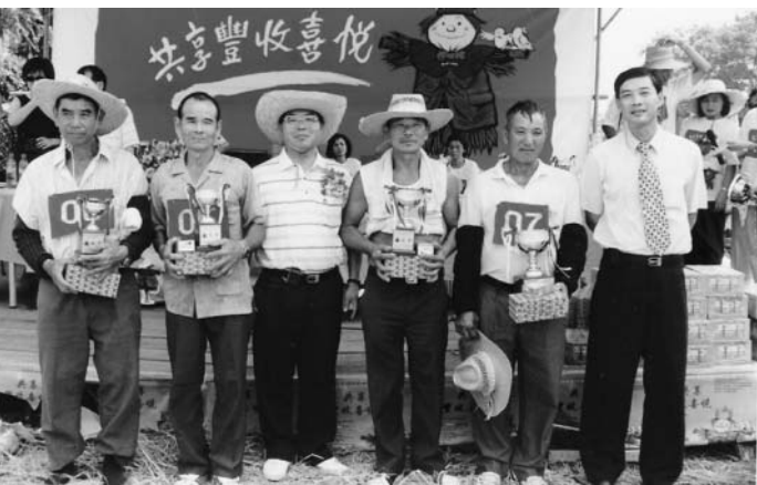
北投關渡平原水稻文化活動讓都會人體驗台北最後一塊散發稻米文化的土地