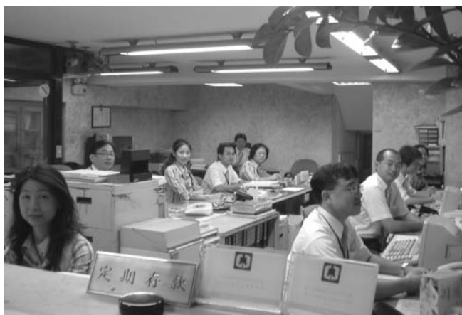
北投區農會職員每天從容迎接顧客上門，能有效降低失誤率