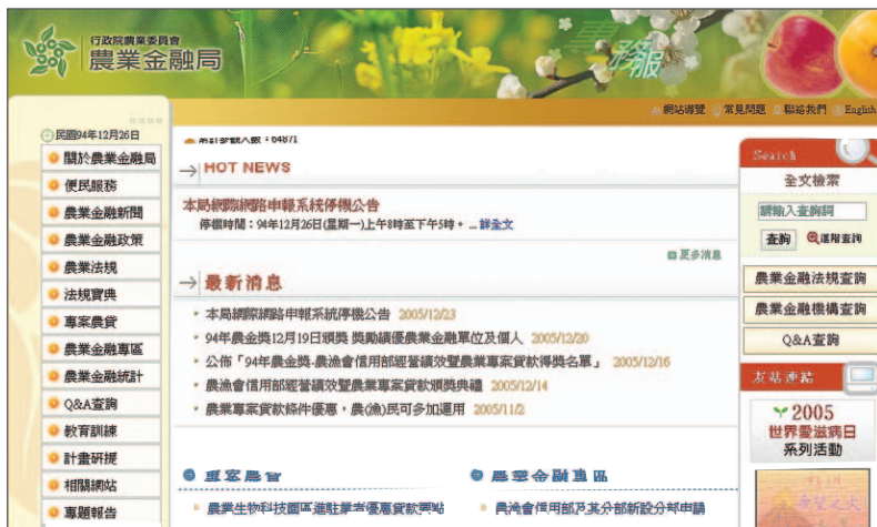
農業金融局全球資訊網(www.boaf.gov.tw)提供完整的農業金融訊息

農漁業為我國基本產業，亦為經濟發展之基礎，為因應面對國際化之激烈競爭與挑戰，農漁業亟需調整產業結構，提升經營效能，是以提振農漁業經營及照顧農漁民福祉，乃為政府之重大政策方針。為協助農漁民及農漁企業順利籌措經營所需資金，以更新設備，加強技術研發與創新，提高產品附加價值，強化產品行銷，提