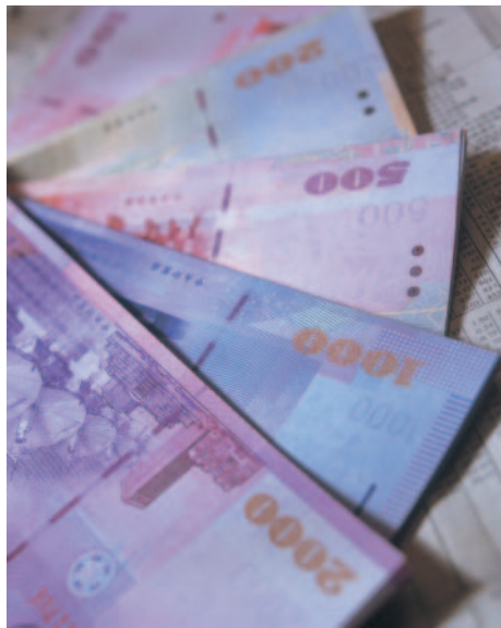
1,000億農業放款協助籌措資金

1,000億元，為政策性農貸350億元及一般農業貸款650億元，由行政院金融監督管理委員會及行政院農業委員會各分別推動500億元。行政院農業委員會推動部分，包括政策性專案農貸350億元及一般農業貸