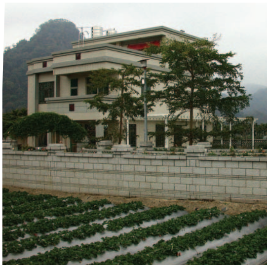
創造良好農業經營環境

農業金融局一直致力於協助創造良好的農業經營環境。94年度專案農業貸款主打貸放條件寬、貸款利率低及還款輕鬆等三大重要訴求，以及由行政院金融監督管理委員會及農業委員會共同推動之1,000億元「加強辦理農業放款方案」，都是著眼於減輕農漁民負擔，在資金充裕支援下，讓有意願從事農業者均能順利獲得低利貸款，以促進我國農漁業發展，並提高政策成效。回顧專案農貸自62年開辦至94年10月底已累計貸放達1,780億元，受益39萬2千餘戶，對增進農民福利及農業發展有相當助益。