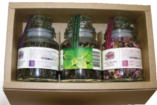
協助農企業籌措經營資金，提高產品附加價值