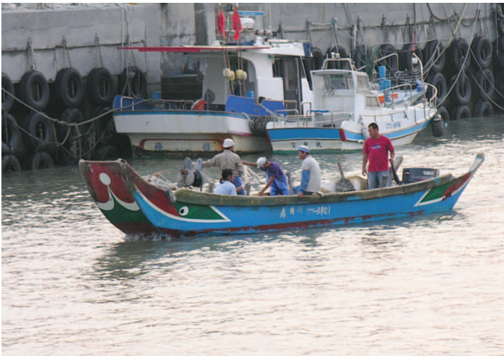
農信保基金協助擔保能力不足之農漁民貸得所需資金

農業金融法」及「提升農業經濟的競爭力」。依據上項共識，農業金融法已於92年7月10日經立法院三讀通過，7月23日經總統公布，並於93年1月30日施行；農漁會信用部改由農委會主管；全