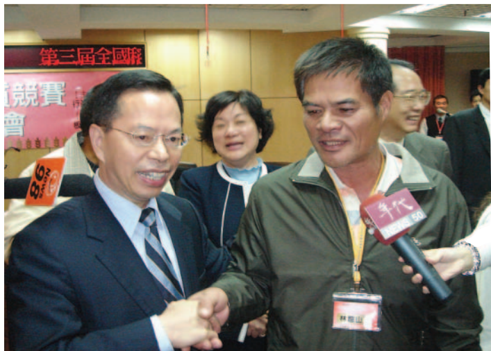
前農委會李主委恭賀冠軍米達人

為提升國產稻米品質與競爭力，農委會多年來鼓勵農民結合稻種及產地特色，生產高品質稻米，除突顯品質價差效益外，也能增進產地知名度。今年「第 3 屆全國稻米品質競賽」活動受到各地鄉鎮與農民踴躍地參與，在經過一連串的評鑑與激烈的鄉鎮初賽，共有 14 個稻米主要產地鄉鎮所選拔出的稻作菁英，取得進入全國賽之資格，再次接受品質外觀性狀與食味官能評鑑。為評選出好吃又兼具完整外觀之冠軍米，評審內容包含外觀成績與食味成績，各項目之評審均由不同之單位負責；為求公正與慎重，全程皆以代碼作業，不到最後階段，無人可以知道比賽結果。