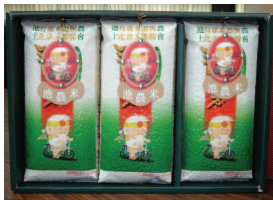
池上農會精美包裝池上米