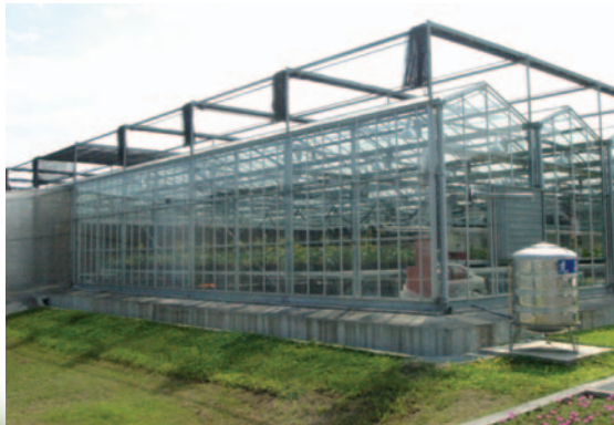
開放讓民眾參觀的溫室