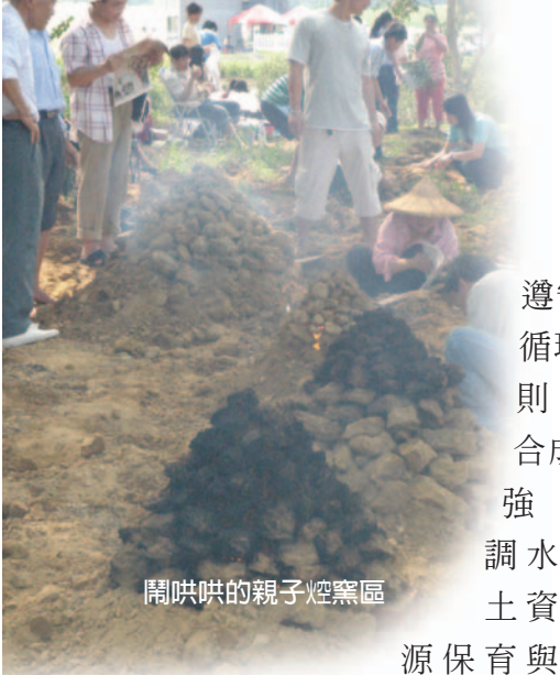
鬧哄哄的親子焗窯區