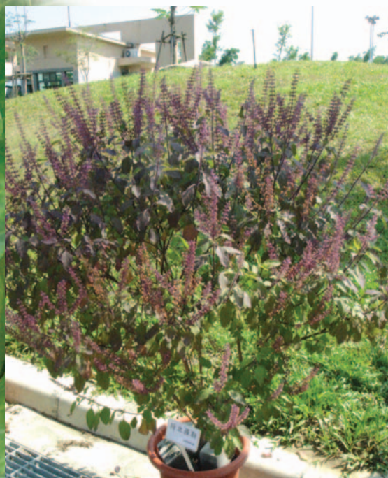
香草區展示區一角