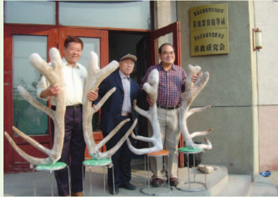
哈爾濱特產研究所創鹿茸紀錄—馬鹿鹿茸

每年 7 - 8 月為割 2 槓茸旺季，通常以外觀形狀、骨化程度(嫩或老)、色澤與氣味等區別鹿茸好壞。梅花鹿茸多以「2 槓是寶」為上品，馬鹿茸則以不超過 4 叉為上品；對於長茸不良、鹿隻受傷或是不夠經濟成本淘汰之公鹿，就可製成砍頭茸裝飾品，每個售價約台幣 3,000 元。價格方面，消費者到