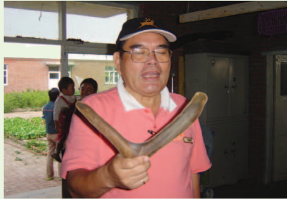
梅花 2 槓鹿茸

場購買梅花乾鹿茸上等(2 槓) 每公斤約人民幣 5,000 元，梅花生鹿茸每公斤人民幣 1,000 元，再生茸每枝人民幣約 100 元；而馬鹿茸價格約為梅花鹿茸之一半。另外鹿隻價格方面，2 歲雄鹿人民幣 3,000 - 4,000 千元，種鹿價格每頭萬元以上。整體收益而言，梅花鹿農扣減飼養成本後每頭鹿收益人民幣約 1,500 元，故鹿農收益甚好。