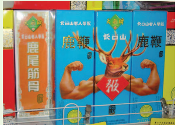
西豐縣鹿產品集散市場鹿鞭酒包裝

為各種鹿產品集散地，一整層市場中批發、零售攤商數十個，除食用之鹿茸、鹿鞭、茸血酒、鹿尾等產品外，亦有各種鹿角或鹿隻裝飾或藝術品，因可殺價，故各種產品價格並不一致。