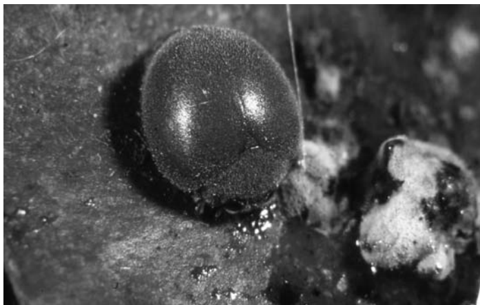
小紅瓢蟲 ( Rodolia pumila ) 是防治柑桔吹棉介殼蟲 ( Icerya purchasi ) 的土產天敵

由於許多生物防治例子即可發現，理想型的防治只需釋放數次天敵，就能順利的將主要害蟲抑制下來，永久性的成為次要害蟲，然而更多的時候，須將天敵當成農藥般，於害蟲發生時撒布使用。因此，對天敵的生物特性與對應環境，該如何恰當拿捏掌握，實是當今值得深切的課題。