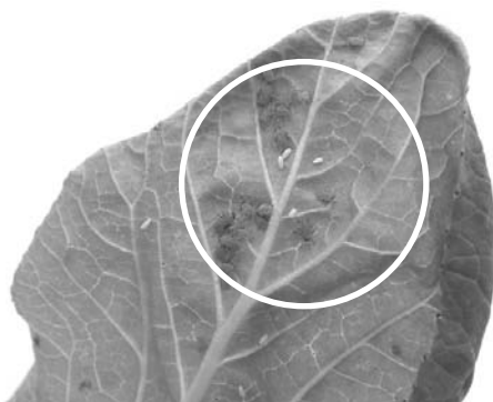
食蚜虻將卵產在蚜蟲群落附近

唯生物防治在某些情況下，仍會呈現不穩定的效果，導致評估天敵效益的指標，如防治率或寄生率，出現較大幅度的起