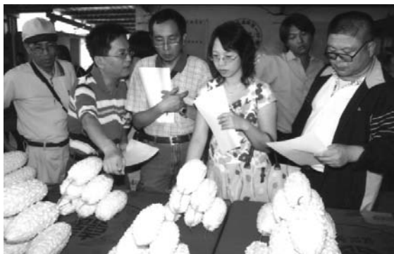
請農業專家擔任評審

入夏後，氣候的悶熱容易使人們心浮氣躁，此時來盤冰涼的苦瓜沙拉，或 1 杯苦瓜冰沙，沁涼之中帶點獨特的苦味，頓時間，身心清涼了不少。現在正值苦瓜盛產時期，想要有個清爽涼快的夏天，就來試試苦瓜大餐吧！