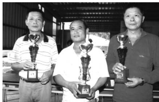
優勝前 3 名合影