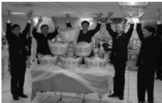
農業金庫服務動起來宣誓