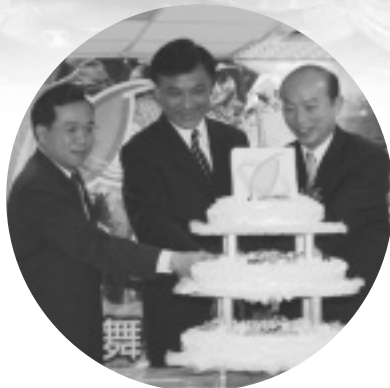
週年生日 切蛋糕儀式

值此農業金庫開業滿週年深具意義的日子，特別受到政府、農政單位及農會、漁會等的重視，週年慶當天，可謂冠蓋雲集，政府官員、農政及財經首長、農會、漁會總幹事及金融同業主管等均蒞臨祝賀。慶祝活動由財神爺及青春舞者以活力熱舞「舞動農業新希望」揭開序幕，隨即在該公司 8 樓舉行週年