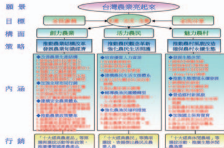
新農業運動施政架構