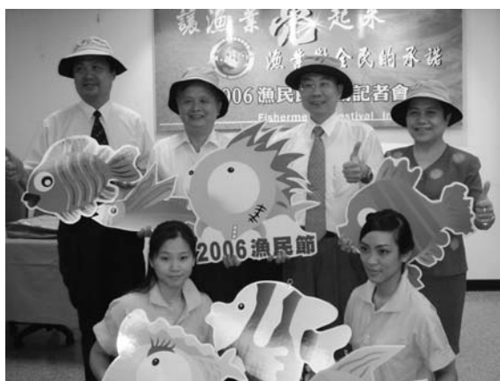
漁業署署長謝大文（後排右二）為活動代言

每年漁民節，各縣市漁業界均舉行各項漁民節慶祝活動，漁業署為展現我國漁業建設成果、宣達我國漁業願景及新農業運動的理念，除辦理傑出漁民選拔及表揚活動外，並委請國立台灣海洋大學以「讓漁業亮起來—漁業對全民的承諾」為主題，「安全、健康、多元、永續」為活動主軸承辦一系列活動，向全國終年辛勞的漁民朋友表示最誠摯的敬意，也讓一般民眾都能了解台灣漁業發展的新面貌。