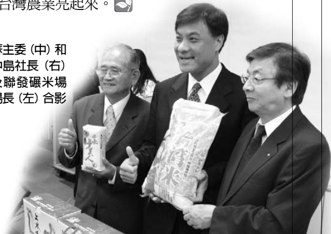
蘇主委(中)和中島社長(右)及聯發碾米場場長(左)合影

農委會主委蘇嘉全表示，「國外原種，台灣產製，全球行銷」，是台灣農產品外銷史上的一項創舉，不但肯定台灣生產環境、技術，也照顧農民的生活。台灣加入世界貿易組織後，外界預期台灣稻米產業將遭受衝擊，但從「夢美人」例子來看，未來在「新農業運動」政策推動之下，農委會絕對有信心把更多的台灣優質農產品推向全世界，讓台灣農業亮起來。