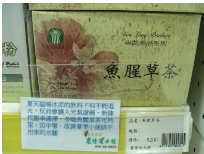
板農貼心為販售產品加上詳細說明

孩子多方尋醫的過程中，因緣際會接觸佛法，深刻感受宗教安定人心的力量，因此當看到農漁民面對困境卻無能為力時，腦海中即浮現舉辦法會的念頭。她說，只要對農民有益，她就願意嚐試，凡事堅定生命的價值觀，無私、無我，就能看得開、放得下，自然能不在乎別人誤解的眼光，懷抱使命勇往直前。