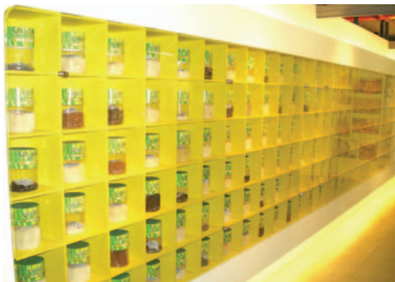
板農蒐羅國內外各地奇特稻米，設立了一面米牆

擔任農業金庫董事後，有更多機會環顧全國各地的農業發展，刺激她思索農業定位與價值的想法更為強烈，每當聽聞哪裡的農作因天災受損、哪裡的農產又因生產過剩滯銷，一股猶如疼惜孩子般的不捨之情，就在心頭猛然竄起，王雪慧認為，