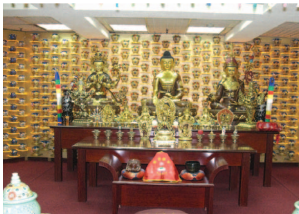
法會會場的布置莊嚴祥和