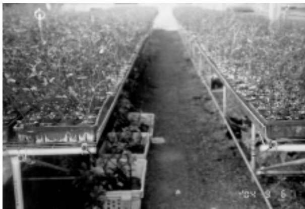
原生植物大安水蓑衣

彰化縣二林鎮的原生植物產銷班共有10位班員，兩年前的種植面積僅有1、2公頃，目前已擴展到10公頃，種類也由原先的1百多種增加到5、6百種，主要以紅樹林、天人菊、馬安籐、竹節草、大安水蓑衣、鹽地鼠尾粟、濱筊草、濱刀豆、鼠尾粟等為主。從育苗開始培育一直至成長為林，都採取大規模栽培，每個品種至少有10萬株以上，作為推廣栽培之用，藉以對抗外來種植物，為國內生