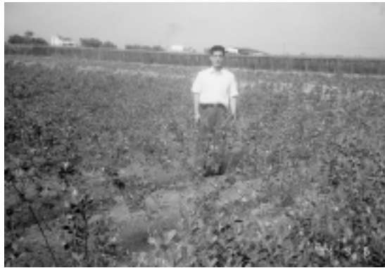
生長良好的原生植物

甚表關心，而國內公共工程美化綠化，已必須種植高比率原生植物，再加上自己有一些原生植物，想加以培育推廣，但是苦無進一步推廣栽植原生種植物的長遠計畫與對策。3人經過討論後，最後終於決定由鎮農會擔任