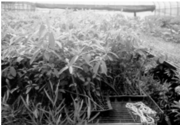
黃史享種植600餘種原生植物

班長異口同聲的指出，他們都是將生長在相同環境，且栽培管理方式較接近的樹種，栽培在同一區，這樣一來，在栽培管理方面可以收到事半功倍的效果，而且只要有系統、分門別