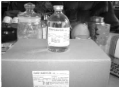
標示不清的非法動物用藥品