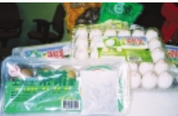
在農委會積極爭取之下，國產雞蛋可望外銷新加坡