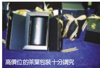
高價位的茶葉包裝十分講究

由於木質包裝密封效果差，不利於茶葉的保質，而陶瓷包裝成本高且易碎，許多茶葉公司重視內包裝，以彌補木盒和陶瓷包裝的缺點。內包裝原料用紙和錫箔，都要盡可能的密封，以防止外部光照和溫度、濕度影響茶葉的色、香、味。上述新穎的茶葉包裝，顯示全球茶葉市場已將從