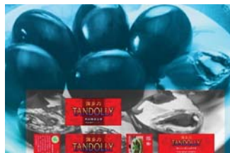
我國皮蛋獲得日方好評

該拓銷團返回台灣後，陸續接獲日方之採購訂單，截至目前為止，在鴨肉方面，至年底前接單量已達700公噸，保守估計明年延續接單數量為1,800公噸；調製蛋品方面，已有多家日方廠商要求寄送樣品，並表達高度採購意願，估計年底前接單量至少有20公噸。在雞肉方面，亦接獲12公噸之訂單。整體而言，此次拓銷活動可謂成果豐碩。