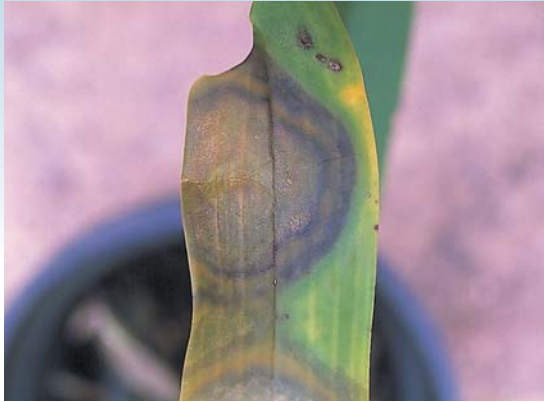
疫病菌徵：罹病部位呈暗綠色水浸狀