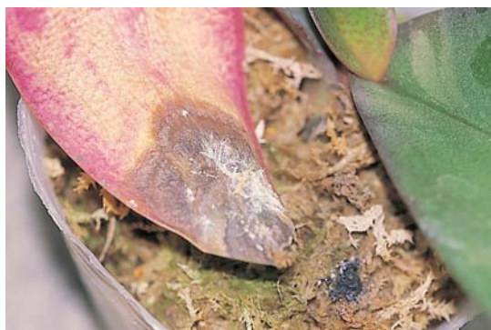
白絹病菌於患部形成白色絹狀菌絲