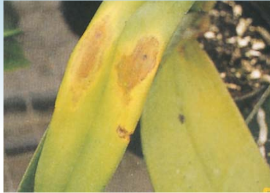
褐斑病病徵：葉片出現長條狀或不規則形大水浸狀斑