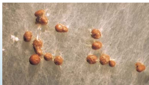
白絹病菌於培養基中形成之成熟菌核，型似蘿蔔種子