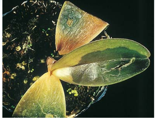
軟腐病病徵：葉片組織崩解、腐爛