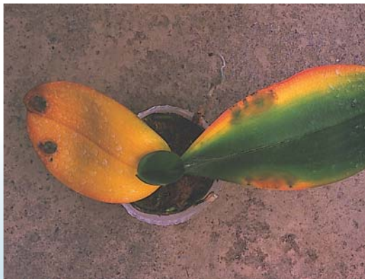
褐斑病病徵：葉片凹陷壞疽斑相互融合成大型斑塊

葉片受感染後首先出現淡褐色水浸狀斑點，之後擴大為暗褐色或黑色的不規則、凹陷壞疽斑，周圍具明顯黃色暈圈，病斑可相互融合成大斑塊，有些會繼續擴大形成橢圓、長條狀或不規則狀的深綠色或黑褐色大水浸狀斑，病斑周圍通常會出現墨綠色環紋，以手觸摸病斑處會感到堅硬。