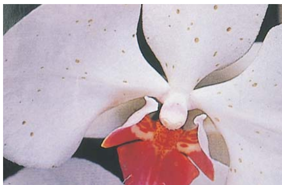
灰黴菌在蝴蝶蘭花瓣上形成斑點