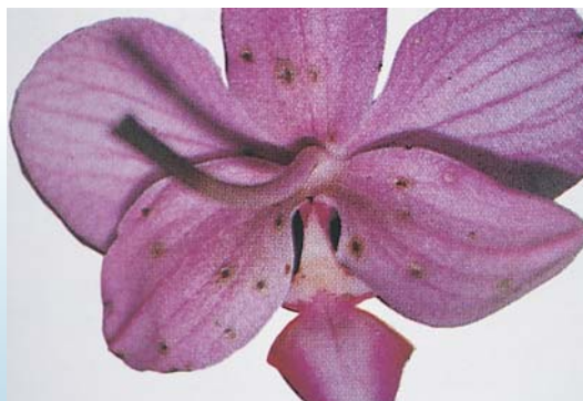
灰黴菌在蝴蝶蘭花瓣上形成斑點（背面）