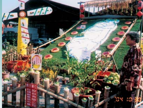
大會利用芭樂果實和樹苗裝飾的台灣芭樂產地——社頭

甜度高。水晶芭的最大特色是籽非常少（又稱無籽芭），質感脆，正常節令甜度高，難管理，因季節差別，果粒甜度不一。蜜芭的果實特大，除口感鬆軟外，味清香芬芳（越成熟愈香甜），最合老年及幼兒食用。