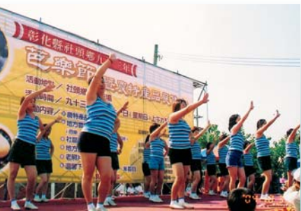
大會還安排一系列表演活動，帶動活力