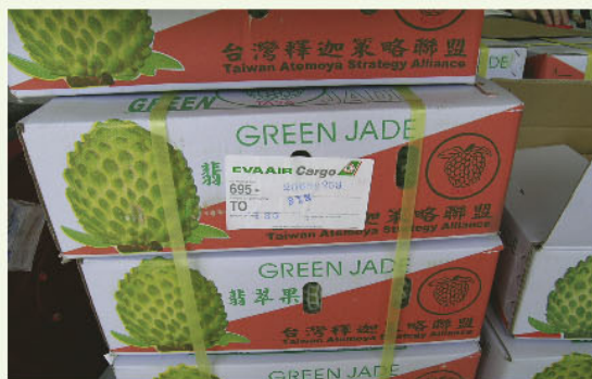
鳳梨釋迦外銷包裝

農委會表示，一般釋迦需於清晨5~8點進行人工授粉，相當辛苦，而鳳梨釋迦則於下午4時後進行授粉，農民可正常作息。一旦外銷市場穩定後，將吸引更多農民投入品種更新行列，該會也開始輔導。鳳梨釋迦果實達成熟時含水量約75%，可溶性固形物可達23° Brix以上，有機酸含量為0.30~0.36%，