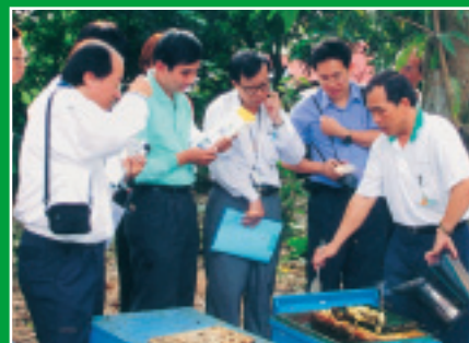
在蜜蜂生態園區為來賓作生態解說