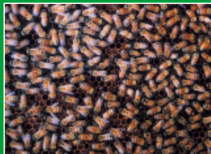
養蜂園施行安全用藥管理