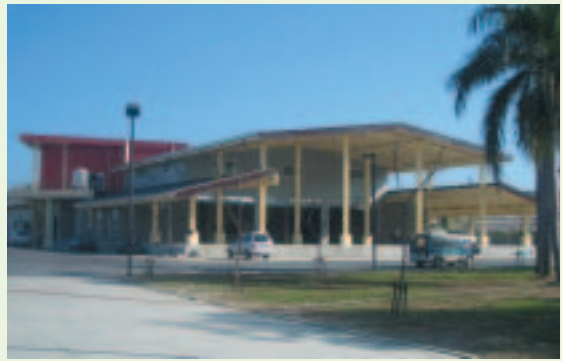
防檢局-高雄燻蒸場

理設施，依據「促進民間參與公共建設法」施行細則第19條之1規定，辦理公開徵求民間投資廠商參與營運管理，並甄選出福爾摩沙物產國際股份有限公司為委託單位。防檢局期藉民間企業經營理念，提供外銷農產品檢疫服務。另該委託單位並規劃增設另一座5噸級之檢疫處理設備，使本設施獲得充分利用，擴大外銷數量。