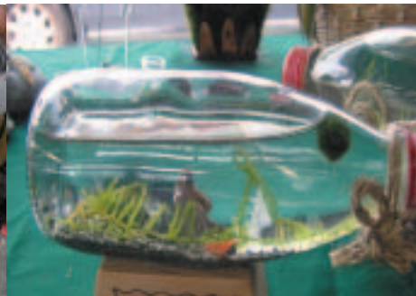
生態瓶是都市人的最愛