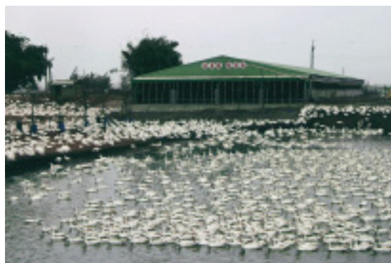
芳源畜牧場鵝群戲水風光