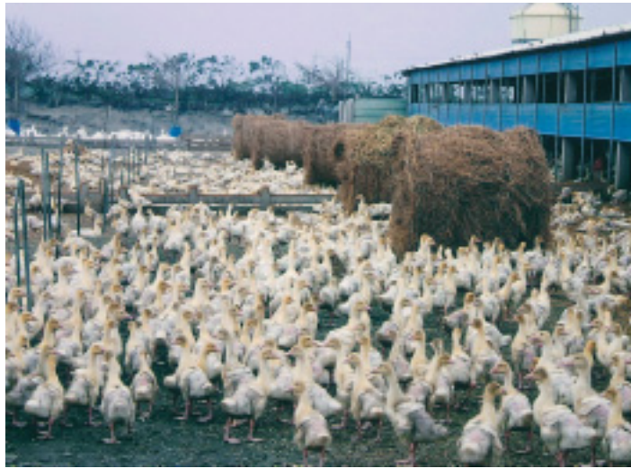
畜牧場內飼養的肉鵝供應新鮮牧草

產銷失衡而影響鵝價，經過多年來與學術界專家學者研究討論，93年初，開發籌建密閉式光照環控水簾式種鵝舍，以嶄新技術克服種鵝產期對季節變化的敏感，利用光照環