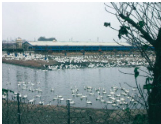
畜牧場周圍均設置圍網與監視系統