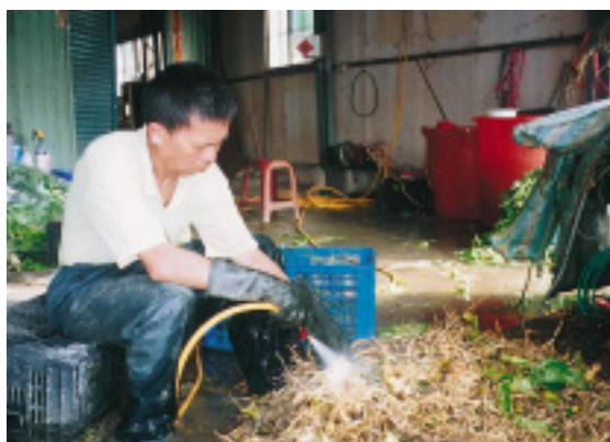
明日葉根部也是寶

合緊密，如利用菌種防治病害的方法，即是與中興大學植病系合作的成果，而農場也提供園地供學術單位進行研究，互補有無，教學相長。