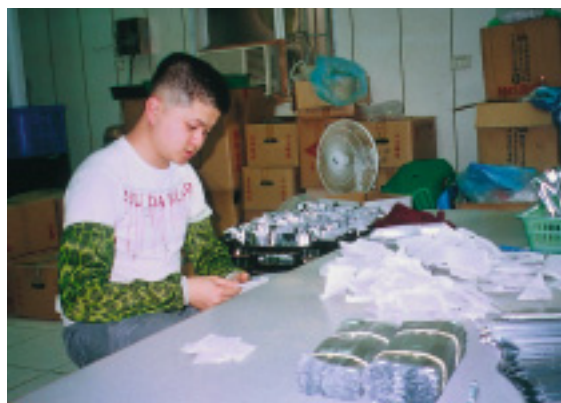
明日葉茶包封裝作業

產成本，並率先使用冷藏設備處理明日葉種子，利用兩階段低溫調控方式，克服種子發芽瓶頸，提高發芽率近百分之百，而全面使用枯草桿菌及放射線菌防治病害，更增加種苗存活率達八成。