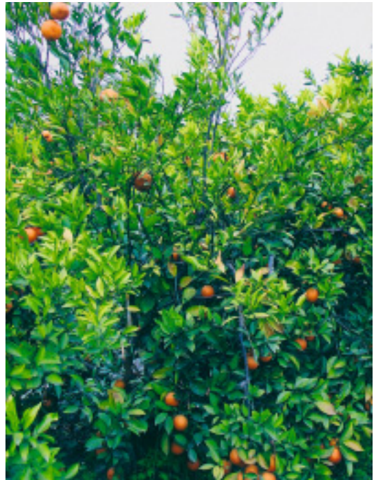
運用嫁接技術將不同柑桔品種接於同一株柑桔果樹上

從事農作，在銷售工商事務機器領域，自有一片天。由於父親對台灣加入WTO後，農業經營遭受嚴重衝擊而憂慮不已，為體恤父親長年耕作的辛勞，不忍其晚年仍承受此打擊，86年間，他決定返鄉接手經營農場。