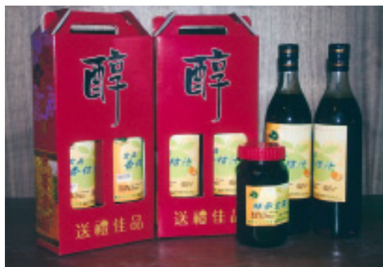
開發柑桔加工副產品，以增加園區營收

片，開創非柑桔生產期的營收，並製作成教育解說牌，作爲輔助說明柑桔生態資訊，吸引鄰近縣市幼稚園與國小學童前來進行戶外教學，讓小朋友在有趣的環境裡接觸大自然、體驗大自然，領略大自然之美。