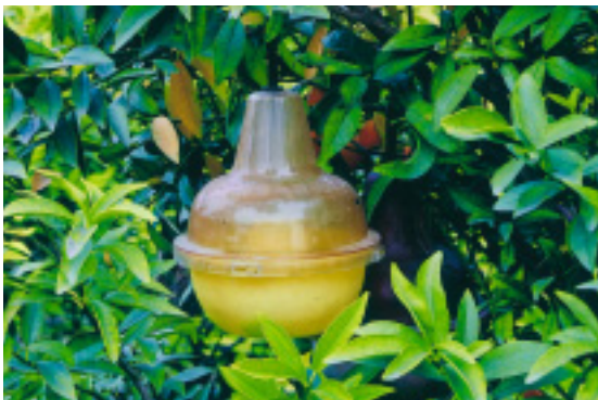
「麥氏誘蟲器」殺果實蠅