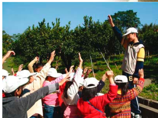
苗栗大湖四份水土保持戶外教學小小解說員宣誓