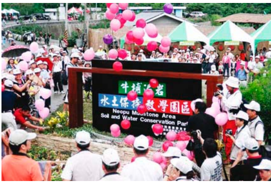
台南縣龍崎鄉泥岩水土保持教學園區開幕

會，華山自然生態與農村資源景觀的有效結合，也讓地方興起一股銳不可擋的民宿風潮，令重建後的華山農業社區徹底脫胎換骨。