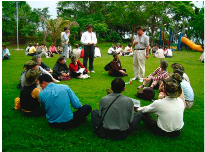
解說員在戶外教室分組討論(花蓮舞鶴)

鄉上林村境內，90年8月間納莉颱風造成多處崩坍地，引發大量土石順流而下，造成下游重大災害，水土保持局會同台北縣政府、雙溪鄉公所勘查後，為免災害擴大立即辦理整治工作。因地制宜，就地取材，運用生態工法辦理，包括打樁編柵、箱籠護岸、塊石護岸、木排樁護岸及拱形固床工等方法，期兼顧生態與安全，同時創造多樣性的水域生態，整治河段原有橋樑通水斷面不足，以及颱風豪雨溢流淹沒的兩岸田地。原有的三明治砌石護岸基礎已掏空，安全堪慮，經多次協商後，地主同意提供部分土地，拆除原護岸，增加溪流寬度以降低洪水位，打木排樁來穩定邊坡，形成緩坡化環境，提供青蛙等兩棲類無障礙的生態廊道，此一治理方式，堪稱為生態工法典範。