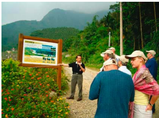
華山土石流教學園區連外國人都前往取經

921地震，華山溪與科角溪上游源頭嚴重崩塌，大量土石淤積在山谷中，經過90年9月間一場豪雨，大量的土石順著科角溪沖刷而下，因河道被逐漸阻塞，溪水挾帶泥砂與土石衝過堤岸，侵入位在溪旁的華山登山步道入山口處，附近的6戶民宅，幸未造成傷亡。農委會為協助華山居民重整家園，由水土保持局著手進行土石流治理規劃，並推動農村聚落重建工作。在兼顧施工安全與自然法則的原則下，華山溪崩塌地下方，樹立起了3座全新梳子壩，有效遏阻了土石流危機。此一治理方式跳脫傳統防砂壩工法，成效良好受到大家的好評，水土保持局特別成立華山土石流教學園區，並結合當地台灣咖啡產業，讓華山社區居民也開始凝聚起來，現在72家以上經營咖啡的業者，不但創造了更多的就業機