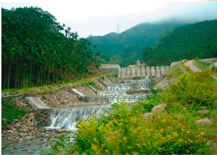
華山土石流教學園區

921大地震後，山區土石鬆動，產生很多崩場地及土石流潛在危險區，水土保持局為維護山坡地公共安全，正全力執行土石流及崩場地源頭，緊急保護處理。運用高科技土石流防災之監測與管理，設置開放式的疏子壩，辦理睦鄰疏散，以及避難處所的規劃，並使用生態工法，就地取材顧及四周環境，維護大自然生機，而水土保持教室也轉型為教學園區，擴大與社區緊密結合，由社區認養及共同維護，使水土保持戶外教室成為社區的最佳公共場