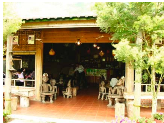
陳家農場的風味餐廳

附註：「九芎湖」與「箭竹窩」合稱「照門地區」，是富麗農村的示範點之一，相關的旅遊訊息，請參考水土保持局網站 http://www.swcb.gov.tw 。