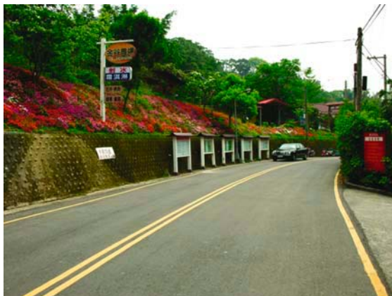
黃泥巴路變成平坦的柏油路